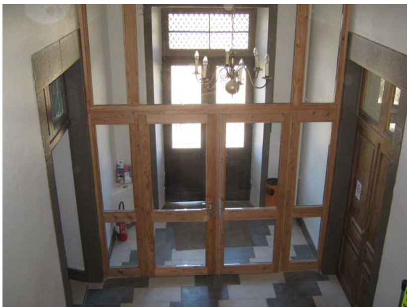
L'entrée de la mairie a été refaite